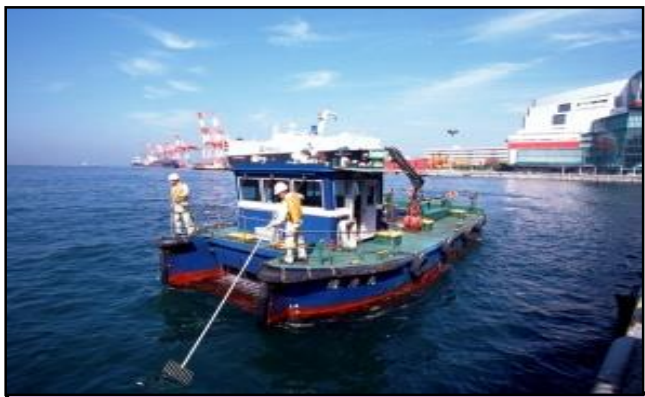
清掃船による港内清掃