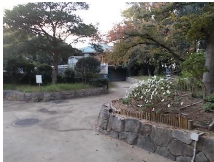
住之江区（野鳥園臨港緑地）