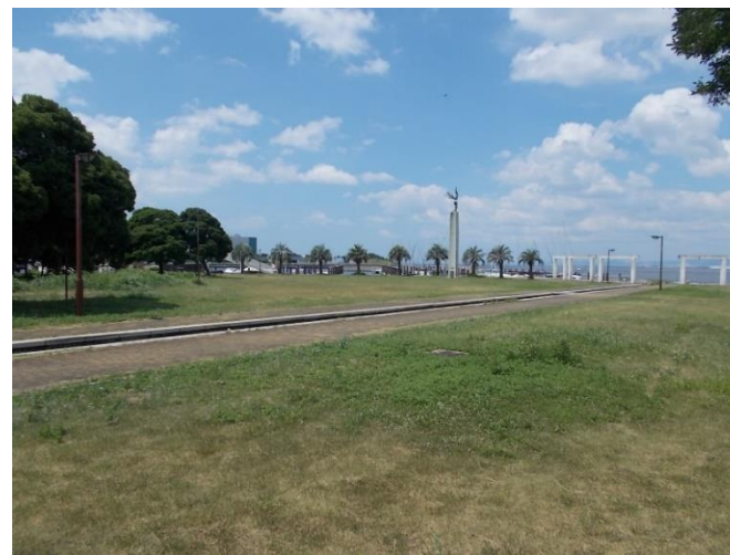
此花区（常吉西臨港緑地）