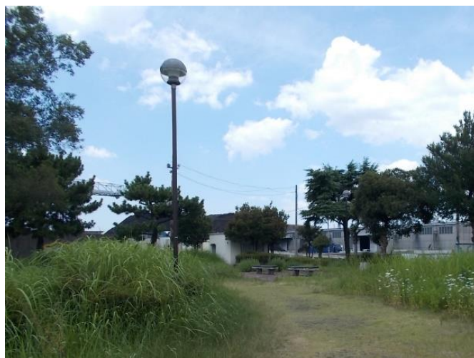
此花区（桜島臨港緑地）