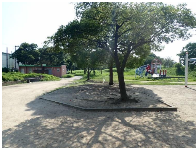
此花区（常吉臨港緑地）