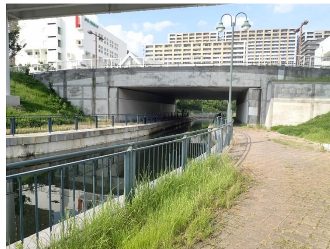
住之江区（コスモスクエア海浜緑地）