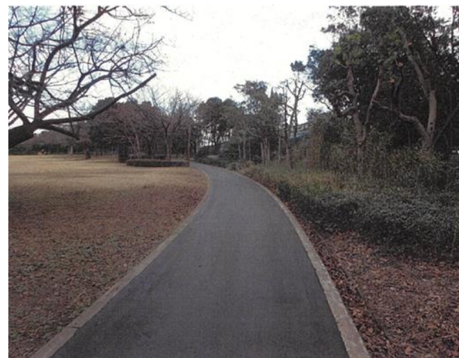
此花区（常吉西臨港緑地）