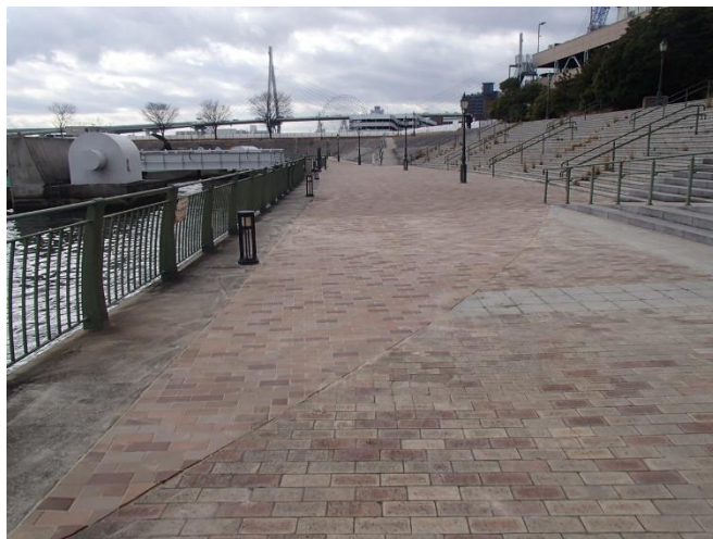
此花区（此花西部臨港緑地）