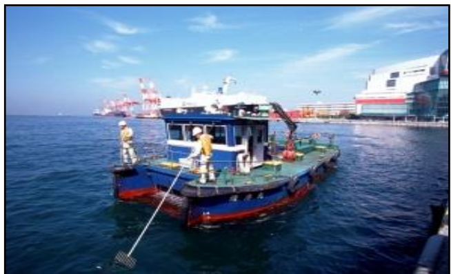
清掃船による港内清掃