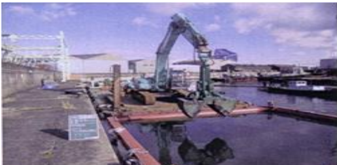
浚渫船による汚染底質の除去