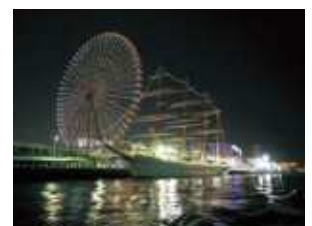
夜間のイルミネーション