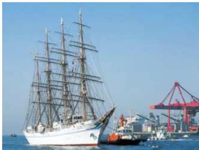
大阪港に入港する海王丸