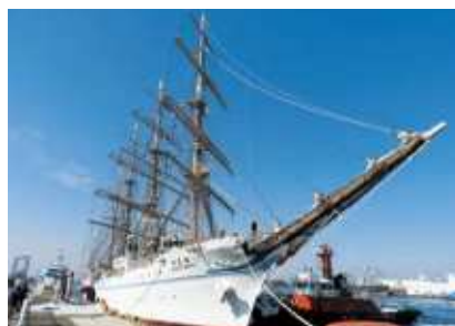
大阪港に停泊中の海王丸