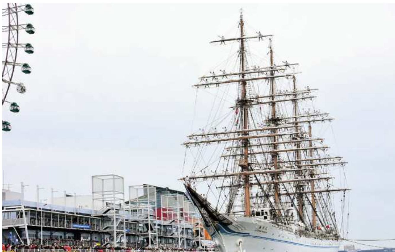
海王丸の乗組員による登しよう礼