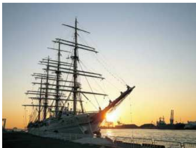
大阪港に停泊中の海王丸