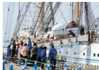
海王丸船内一般公開