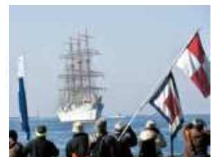
大阪港に入港する海王丸