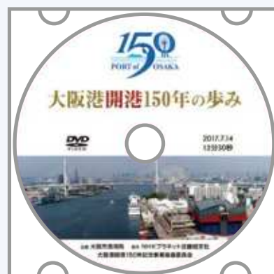
大阪港開港150年の歩み(日本語版)