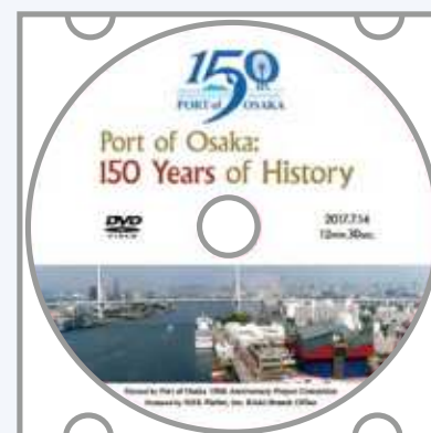
大阪港開港150年の歩み(英語版)