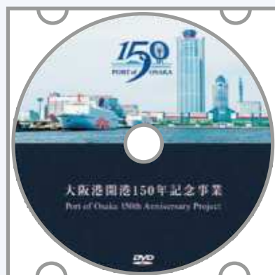
大阪港開港150年記念事業記録映像