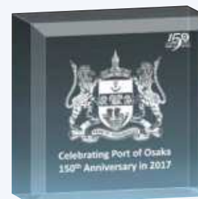
記念式典記念品(パーパーウェイト)