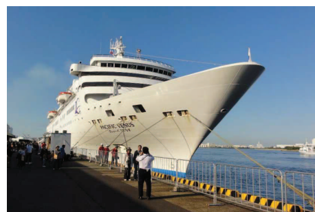
【堺泉北港大浜埠頭第5号岸壁】