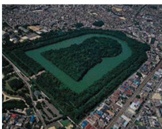
【世界文化遺産「百舌鳥・古市古墳群」】

府域の多様な観光素材を活かし、大阪府域全体へのクルーズ客船の乗客の訪問促進、クルーズ客船寄港による観光振興・地域活性化を図ります。