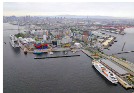
【中央突堤北岸壁(手前)】