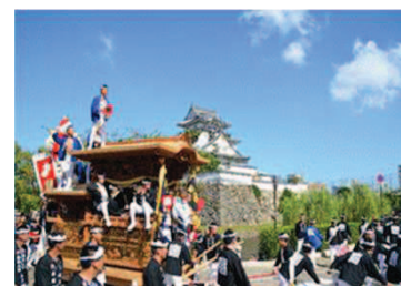
【岸和田だんじり祭】