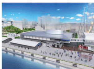
【新ターミナルのイメージ図】