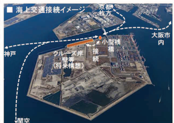
【大阪港(夢洲)を中心とした海上交通ネットワーク(イメージ)】

さらに、夢洲の小型栈橋に隣接してクルーズ客船用岸壁を整備した場合には、小型旅客船による関西国際空港との接続によって「フライ&クルーズ」の促進が期待でき、また神戸や大阪市内との接続によって、クルーズ客船の乗客への多様なオプションルツアーの提供やエクスカッション※の利便性向上につなげることが可能となります。