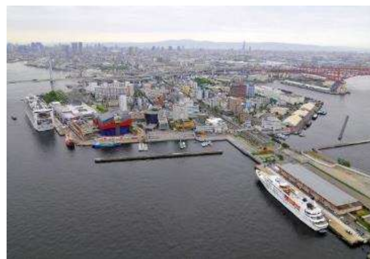
【中央突堤北岸壁(手前)】