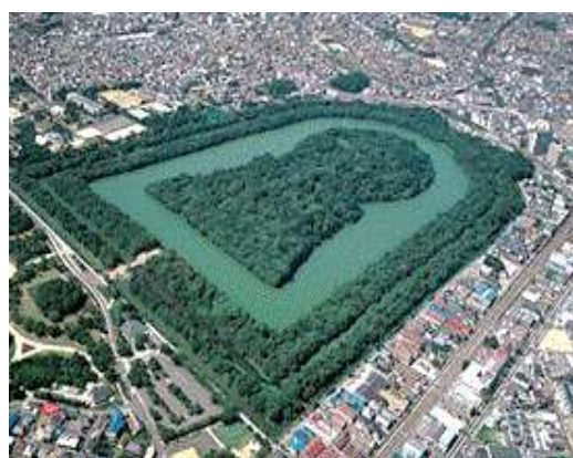
【世界文化遺産「百舌鳥・古市古墳群」】

府域の多様な観光素材を活かし、大阪府域全体へのクルーズ客船の乗客の訪問促進、クルーズ客船寄港による観光振興・地域活性化を図ります。