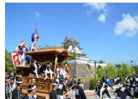
【岸和田だんじり祭】