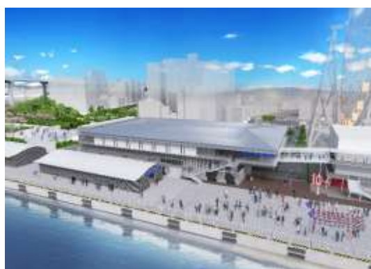
【新ターミナルのイメージ図】