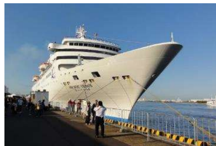
【堺泉北港大浜埠頭第5号岸壁】