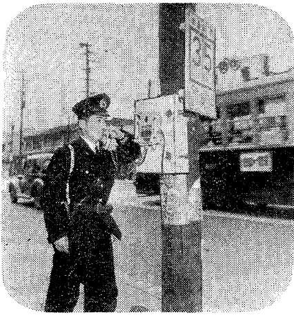
交差点に設けられた警察街頭電話

時、玄関の物音などには聞きにくい。まして、そのと音をあげられても全く気が付かない。こんな時こそ戸締りが必要。 時、玄関の物音などには聞きにくい。まして、そのと音をあげられても全く気が付かない。こんな時こそ戸締りが必要。