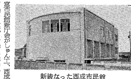
新装なった西成市民館

一昨年から昨年にかけて、大阪城修復委員会が、一番橋、六番橋など建造物を中心に大阪城の修復を行った。石垣の修理は、乾槽(追手門学院の側)東北角を施工した。他、他の箇所も修復の都合で取壊された。 一昨年から昨年にかけて、大阪城修復委員会が、一番橋、六番橋など建造物を中心に大阪城の修復を行った。石垣の修理は、乾槽(追手門学院の側)東北角を施工した。他、他の箇所も修復の都合で取壊された。