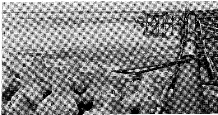
埋立て工事中の南港臨海工業地帯