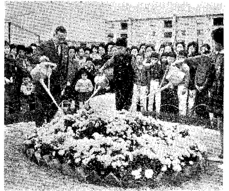
古市団地の花壇に水をやるすみれ小学校の児童と和爾助役

本年末現在で、工業統計調査と中小企業総合基本調査が同時に行なわれます。調査員が伺いましたら、説明を聞いて調査にご協力ください。