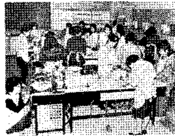
婦人会館の料理講習会