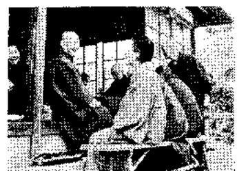
いこいの家でひとときをたのしむ

「とし市内の小学校に入学するのは、昭和31年4月2日から、昭和32年4月1日までに生まれたこともちです。」