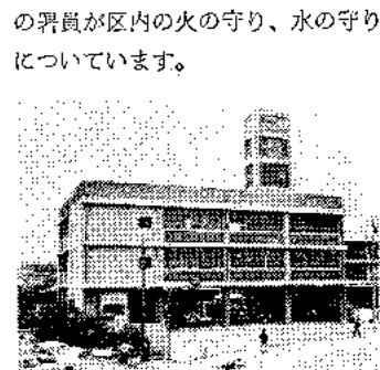
新設の福島消防署

新設の福島消防署は鉄筋3階建てで、高さ24mの望楼があり、常備車3台、予備車1台が配置されています。管内出張所は、上福島・下福島・海老江の3カ所、本署・出張所合わせて、7台のポンプ車と105名の署員が区内の火の守り、水の守りに関わっています。