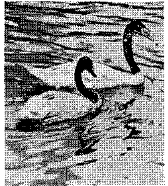
なかよく黒えり白鳥

新居は、動物園の中央門をはいった広場に、このほど完成した噴水つきの水鳥の池で、世界の鳥類の中でも最も美しいといわれるフラミンゴ(べにづる)といっしょにはなし飼いにされています。