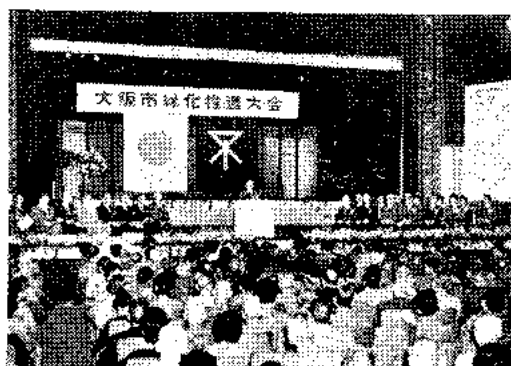
中央公会堂で開かれた緑化推進大会