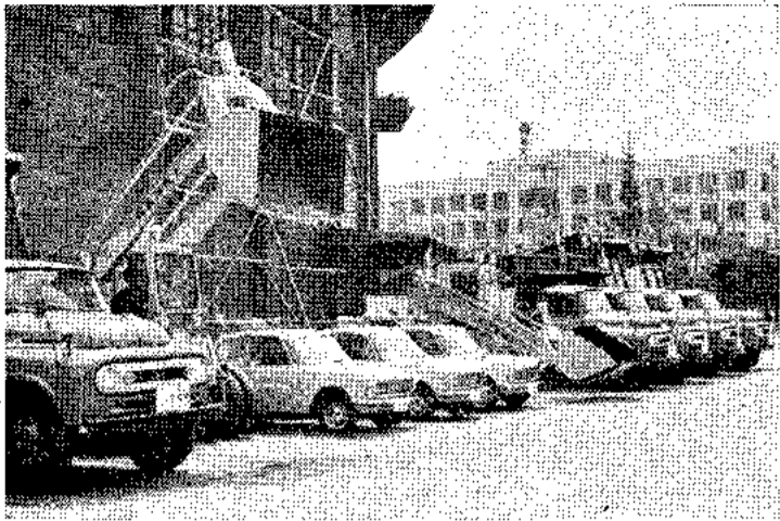
発足式に勢ぞろいした新設の清掃機動隊(扇町公園で)