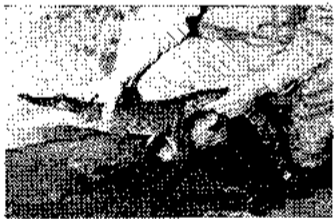
寄贈された子ワニ ニューギニアの子ワニ来園 ニューギニア産の子ワニが、動物園に寄贈されました。この子ワニは先月開催された大阪国際見本市に、オーストラリア領ニューギニアが初

参加したのを記念に、大阪市へプレゼントされたもの。クロコダイル種で体長80cm、成長すれば6~7m