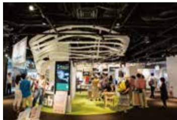
▲多彩な技術やアイデアが集う「ナレッジサロン」や、来場者参加型の展示空間「The Lab. (ザ・ラボ)」では、これまで次世代電気自動車などが商品化されてきました。

問い合わせ 都市計画局うめきた整備担当 ☎6208-7838 FAX6231-3751