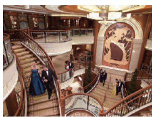
クイーン・エリザベス船内

世界で最も有名な客船「クイーン・エリザベス」の船内見学会。定員各34人。18歳未満は20歳以上同伴。当日、メール会員への登録が必要。☎①3/15(木)②3/22(木)いずれも13:00~15:00(※時間は変更の可能性あり)☎集合:天保山客船ターミナル☎2/15☎申☎または往復ハガキに、参加者全員(2人まで)の住所・氏名(ローマ字併記)・年齢・電話番号・性別・生年月日・国籍・当日持参する身分証明書(パスポートまたは運転免許証)の番号、希望日時(①、②どちらか)を書いて、〒559-0034住之江区南港北2-1-10 ATCビルITM棟10階、港湾局振興課「QE船内見学会」係へ。☎大阪市総合コールセンター☎4301-7285☎6373-3302