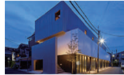
第31回大阪市ハウジングデザイン賞受賞住宅