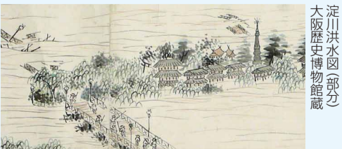
淀川洪水図(部分) 大阪歴史博物館蔵

日6/25(月)まで9:30~17:00(入館は16:30まで)火曜休館 場問大阪歴史博物館 ☎6946-5728 FAX6946-2662