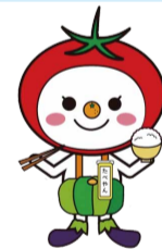
大阪市食育推進キャラクター「たべやん」

①天王寺動物園での食育クイズラリー。対象は小学生以下。日6/9(土) 場天王寺動物園②あべのハルカス近鉄本店での食生活診断。日6/15(金) 場あべのハルカス近鉄本店 問健康局健康づくり課 ☎6208-9961 FAX6202-6967