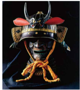
三十二間総覆輪阿古陀形筋兜 [大阪城天守閣蔵]

天守閣の収蔵品の中には、さまざまな「顔の表現」のあるものが含まれます。目を凝らさないとわからないような細かい技巧、見るものの心に働きかける豊かな表情など、多種多様な顔が見られる資料を集めました。①7/19(木)まで9:00~17:00(入館は16:30まで) ②場内 大阪城天守閣 ☎6941-3044 FAX6941-2197