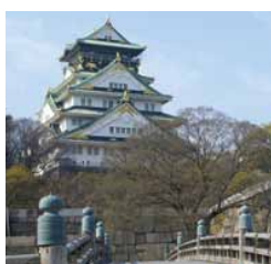
大阪城と極楽橋