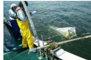
大阪湾のマイクロプラスチック調査