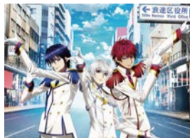
「K SEVEN STORIES」 日本橋ストリートフェスタ2020描き下ろしVer. ©GoRA・GoHands/k-7project

趣味のまち「日本橋」の魅力アピールします。当日は周辺道路において交通規制が行われます。ご理解・ご協力をお願いします。