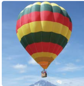
◆ 熱気球体験 (大芝生広場) ※事前申込必要