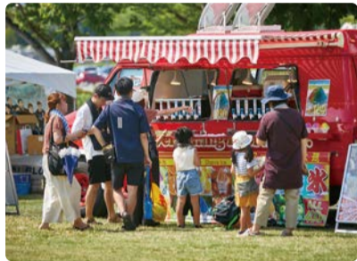
◆ キッチンカー、マルシェ