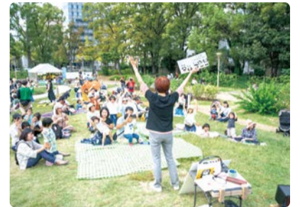
◆ 公園活用プログラム (えほん読み聞かせなど)