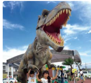
◆ 公園に恐竜が出現!?