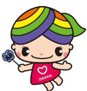
大阪市人権啓発マスコットキャラクター「にっこりな」

私たち一人ひとりが人権の尊さを考え、すべての人の「人権が尊重されるまち」をみんなで築いていきましょう。専門相談員による人権相談(無料・秘密)