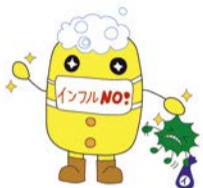
インフルエンザ対策マスコットキャラクター「マウテ君」

冬はインフルエンザが流行しやすい時期です。症状は風邪に似ていますが、高熱・頭痛・筋肉痛などの全身症状が強く、肺炎などの合併症を引き起こすこともあります。日頃から手洗いやマスクを着用するなどの咳エチケットを心がけ、予防しましょう。