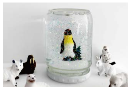
スノードームのイメージ

スノードームづくりなどを通して、下水道や水環境について親子で学べるワークショップなどを開催。日時はプログラムによって異なります。詳しくはHPをご覧ください。