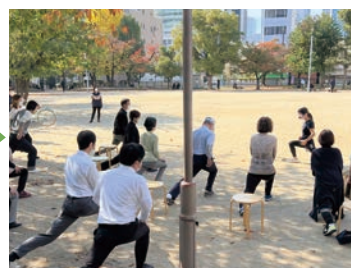
お昼休み☆20分ゆるゆるストレッチ