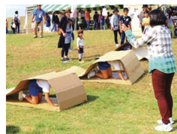
ダンボールキャタピラー

問い合わせ▶建設局調整課 ☎06-6615-6704 FAX 06-6615-6070