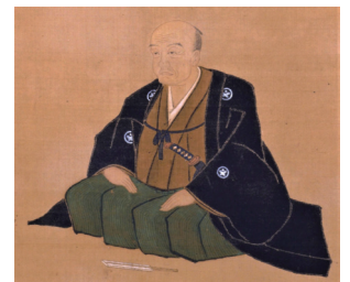
近松門左衛門像(部分)江戸時代(18世紀) 大阪歴史博物館蔵