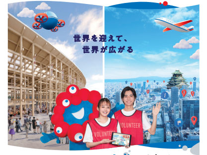
会場内での案内もまちながでのおもてなしも

社会的な成功を夢見た女性たちを育んだ、大阪の文化的な土壌について考えてみませんか。