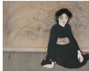
島成園《無題》大正7年(1918) 大阪市立美術館【同期展示】