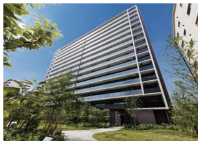
カサレウエストゲートシティ(住之江区)

第36回大阪市ハウジングデザイン表彰式にあわせて、シンポジウムを開催。これまでの受賞者とともに過去の受賞住宅を振り返りながら、これからの都市型集合住宅に求められるものについて考えます。定員100人(先着順)。