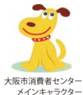
大阪市消費者センターメインキャラクター エルちゃん

「スマホでSNSの広告を見て、化粧品を1回だけのつもりで購入したが、定期購入契約になっていた」などのトラブルが増えています。困ったら、気軽にご相談ください。消費生活相談は市内在住の方に限り、☎・面談(事前予約制)・✉で行っています。 📅 月～土曜10:00～17:00(祝日除く) 🗨 大阪市消費者センター消費生活相談専用電話 ☎06-6614-0999 📠06-6614-7525