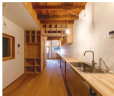
改修イメージ(改修前→改修後)