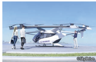
空飛ぶクルマの機体イメージ