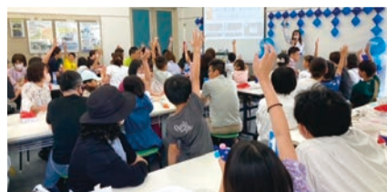
クイズ大会の様子

小学生を対象に、水に関するワークショップや体験型のイベント、謎解きなどを開催。定員各回70人。