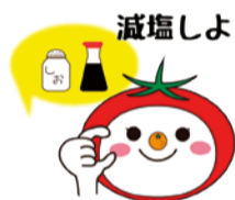
大阪市食育推進キャラクター「たべやん」

食塩の摂りすぎは循環器疾患やがんとの関連が大きいといわれています。高血圧など生活習慣病予防のために、普段の食生活を見直し、できることから始めてみましょう。簡単な減塩のコツなど詳しくはHPをご覧ください。