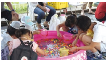
受賞住宅での夏祭りの様子

魅力ある良質な集合住宅を表彰する「大阪市ハウジングデザイン賞」を実施。推薦いただいた方の中から抽選で50人に図書カード(500円分)をプレゼント。