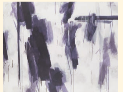
木下佳通代《LA'92-CA681》1992年 大阪中之島美術館蔵