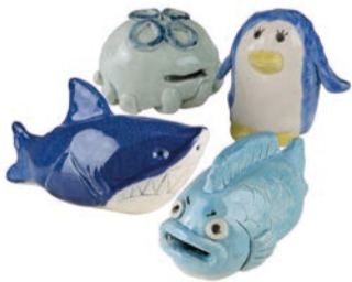
陶器の貯金箱作品イメージ

吹きガラス・陶芸・染色・織物・木工・金工など11種類の本格的な工芸体験ができる体験教室。定員4～28人(先着順)。空きがあれば当日参加もできます。各教室の対象年齢や費用など、詳しくはHPをご覧ください。