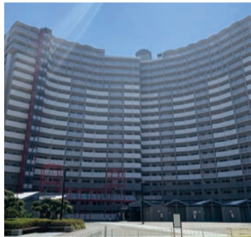
第36回ハウジングデザイン賞 特別賞受賞住宅 ペイシティ大阪