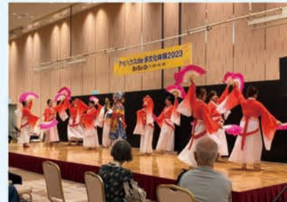
昨年の様子(中国の京劇)

日本在住の外国人による言葉、文化、料理の紹介や、伝統楽器の演奏、踊り、劇などを楽しめるイベントを開催。さまざまな文化への理解を深めましょう。 日 8/3(土) 11:00～16:30 場 大阪国際交流センター(天王寺区) 問 (公財)大阪国際交流センター ☎06-6773-8989 FAX 06-6773-8421