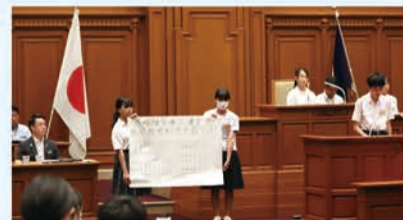
昨年の様子(中学生市会)

市長に質問や提案をするために、議員になってみませんか。対象は市内在住または在学の小学5・6年生。定員81人。 日 8/19(月) 14:00～17:00 場 市役所8階 市会本会議場 締 7/8 申 学校で配布される応募用紙(HPにも掲載)に必要な事項を書き、学校を通して応募。 問 教育委員会初等・中学校教育担当 ☎06-6208-9186 FAX 06-6202-7055