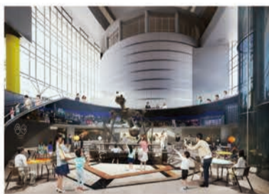
リニューアル後のイメージ 地下1階「アトリウム」

日 8/1(木)～11/24(日) 9:30～17:00 (入場は16:30まで)、月曜(祝日の場合は翌平日)休館(8/5・13は開館) 料 観覧料: 大人400円ほか