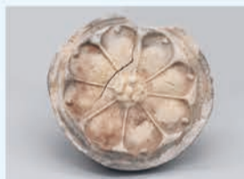
難波宮造営以前の素弁八葉蓮華文軒丸瓦 難波宮跡出土 7世紀前葉 大阪市教育委員会蔵

なにわのみや 難波宮跡の第1次発掘調査開始から70年の節目を記念した特別展を開催。発掘調査成果を中心に、周辺資料や伝承をまじえながら、難波宮の画期性と「大化改新」のかかわりを分かりやすく紹介します。 日 7/5(金)～8/26(月) 9:30～17:00 (入館は16:30まで)、火曜休館(8/13は開館) 料 大人1,100円ほか 場 問 大阪歴史博物館 ☎06-6946-5728 FAX 06-6946-2662