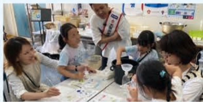
水に関する実験の様子

水に関するワークショップや体験型のイベント、謎解きなどを開催。対象は未就学児～小学生。定員各回70人。 日 ①7/20(土)・21(日)②7/27(土)・28(日)各日10:00～11:15、12:20～13:35、14:30～15:45 申 ①7/7 ②7/14 各17:00までにHPで。 場 問 水道記念館 ☎06-6320-2874 FAX 06-6324-3114