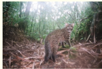
イリオモテヤマネコ