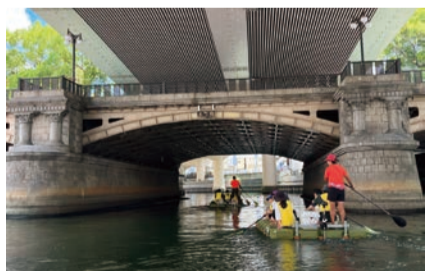
手漕ぎボート体験の様子

浄水場や下水処理場の施設見学、手漕ぎボートによる東横堀川の周遊体験を通して「水」について学びます。対象は市内在住または在学の小学生とその保護者(1組4人まで)。定員80人。昼食・飲み物は持参してください。