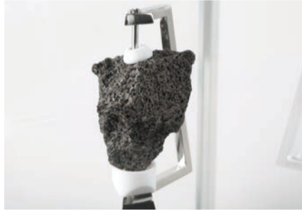
月の石(アポロ15号採取)

1970年の大阪万博で人々が夢見た体 験を、当時の記録映像や万博関連資料と ともに紹介。前期は万博で使用されたも のと同機種の大型コンピュータなど、後 期はNASA所蔵の「月の石」の実物や宇 宙服などを展示します。