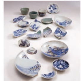
鍋島 江戸時代中期頃(17世紀末~18世紀前葉) 佐賀藩蔵屋敷跡(北区) 大阪市教育委員会蔵

大阪が天下の台所として栄えた江戸時 代、年貢米や特産品を販売するために各 地の藩が中之島とその周辺に構えた蔵 屋敷について、発掘調査成果を中心に展 示します。