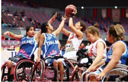
過去大会の様子(日本vsタイ)

オーストラリア、ドイツ、タイ、日本の各国代表チームによる迫力のある試合を、会場で観戦しませんか。