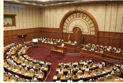
昨年の様子(市会議場で開催)

議員になって、市長に質問や提案をしてみませんか。対象は市内在住または在学の小学5・6年生。定員81人。 日 8/19(水) 14:00~17:00 場 市役所7階 市会特別委員会室 締 7/3 申 問 HPまたは学校で配布される応募用紙に必要事項を書き、学校を通して応募。 問 教育委員会事務局初等・中学校教育担当 ☎06-6208-9186 FAX06-6202-7055