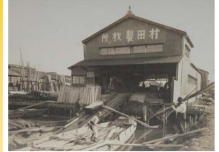
村田製材所(写真展示) 大正期 大阪歴史博物館蔵

鉄工所や製材所、硝子加工所など、大阪ゆかりの町工場に関する大正時代から昭和時代までの資料を中心に展示。現在のくらしに身近なものづくりの歴史を紹介します。 日 6/29(月)まで9:30~17:00(入館は16:30まで)、火曜休館 ¥ 大人600円ほか 場 問 大阪歴史博物館 ☎06-6946-5728 FAX06-6946-2662