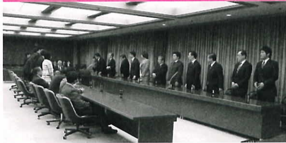
決算特別委員会の起立採決の様

平成19年度の一般会計等の決算報告などを審議する12月市会定例会を昨年12月3日から12月25日まで開きました。決算報告については、12月3日の本会議において決算特別委員会を設置した後、5日から7日間にわたり審査を行い、25日の本会議において、賛成多数により認定しました。