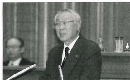
新田決算特別委員長

決算特別委員会では、12月9日から5日間、各委員がさまざまな観点から質疑を行いました。