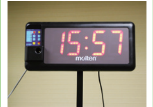
【残時間表示の様子】

代表質問及び一般質問の際には、質問する議員の発言時間があらかじめ決められています。そこで、写真のような時間表示計を左右に2台設置し、残時間が一目でわかるようにしています。なお、理事者の答弁時間の制限はありません。