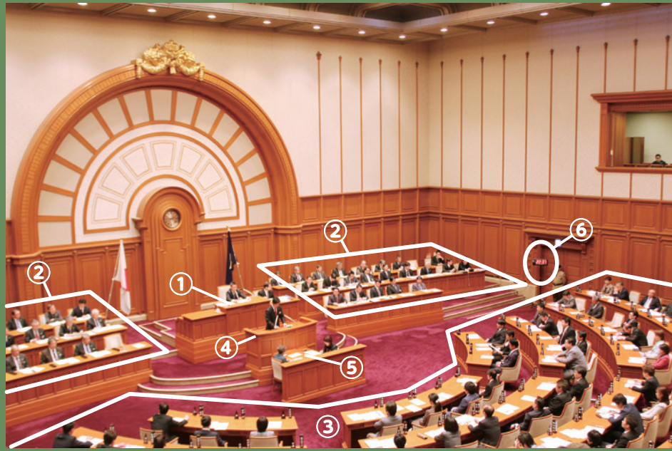
傍聴席(左側)から見える風景