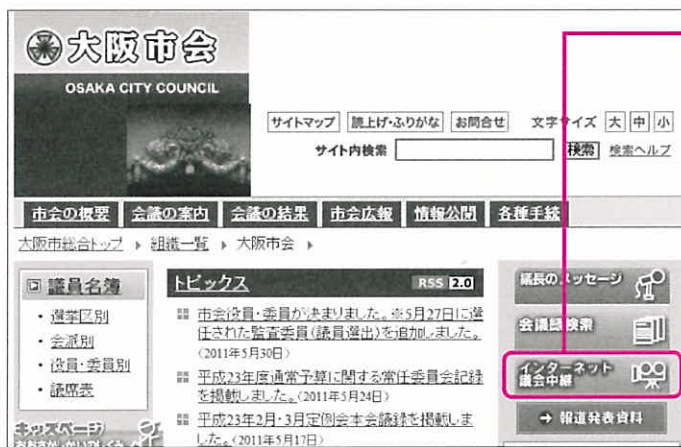
大阪市会ホームページトップページ

本会議の一部及び常任委員会・特別委員会を放映します。会議の3日後(土日・祝日を除く)から議事録がホームページに掲載されるまでの間、放映します。該当ページの「再生する」のアイコンをクリックすると、映像が再生されます。