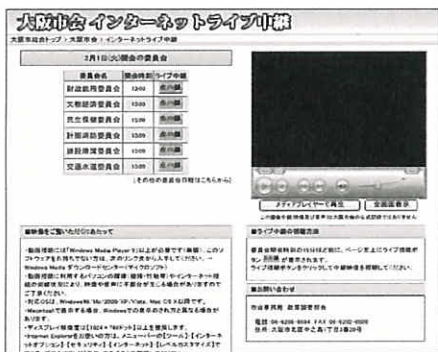
ライブ中継ホームページ

常任委員会・特別委員会を放映します。委員会開会時刻の15分ほど前に表示される「生中継」のアイコンをクリックすると、映像が再生されます。