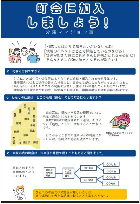
城東区：分譲マンション用