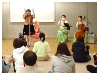
(写真)生演奏とおはなしの世界