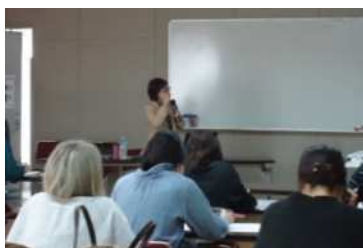
(写真) 子どもと性の話をしませんか？ ～保護者として知っておきたいコト～の様子