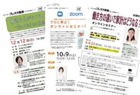
各種セミナーのちらし