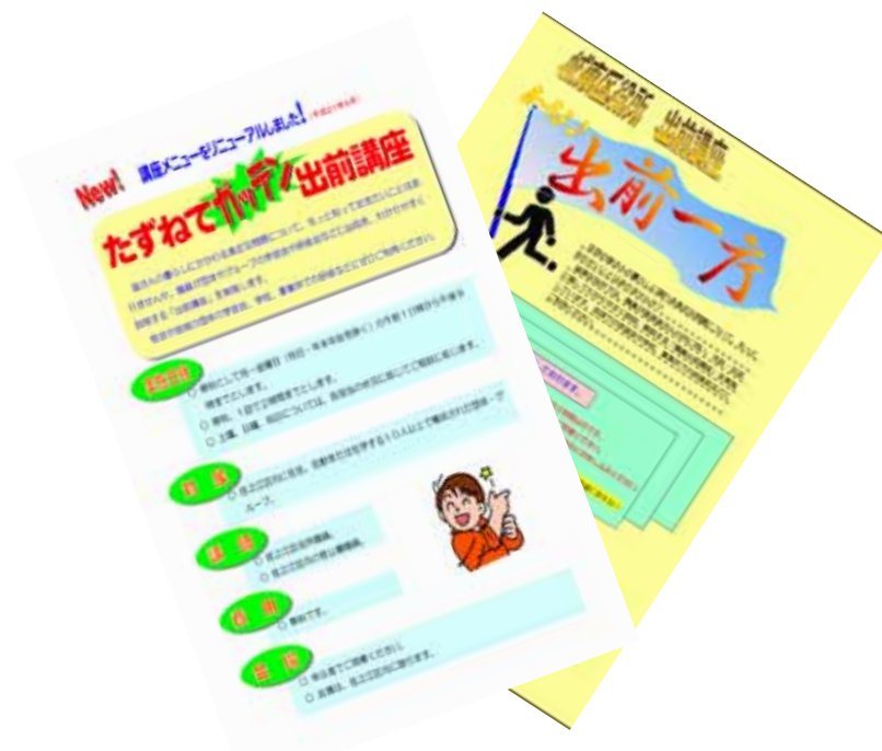
住之江区「たずねてガッテン」と 城東区「出前一庁」

地域の皆さんで構成された概ね10名以上の団体・グループからのお申込みを受けて、区役所の職員等が直接ご希望の場所に伺い、区役所や事業所などで行っている業務内容や事務手続き、皆さんの暮らしに関わる様々な情報など、ご要望のテーマについて、できるだけわかりやすく説明・解説する取り組みを行っており、一部の区では、市税事務所、消防署、警察署など官公署も参加しています。平成21年度は、24区で計549講座を開設し、多くの方に参加いただいています。