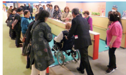
人権啓発推進員対象研修会

問い合わせ 東住吉区役所 区民企画課 ☎06-4399-9908 FAX 06-6629-4564