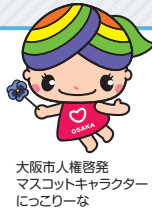
大阪人権啓発 マスコットキャラクター 「っこりーな」

大阪人権啓発推進協議会は、一人ひとりの人権が尊重される明るいまちづくりを進めることを目的とした人権啓発組織であり、また、同協議会の取組みの担い手として、大阪人権啓発推進員の方々に地域での人権啓発活動にご尽力いただいております。