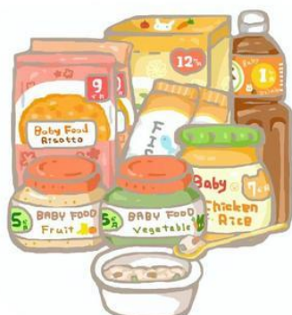
真空包装婴儿断奶食品