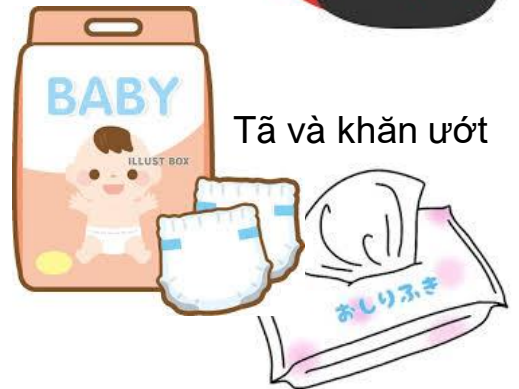
Tã và khăn ướt