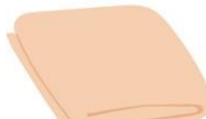
Áo choàng dạng chăn / Chăn