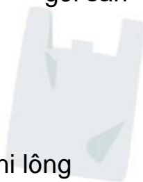
Túi ni lông