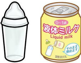
Bình sữa / Sữa nước dùng một lần