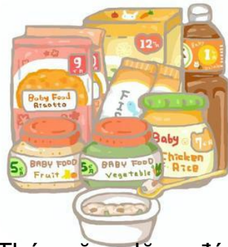
Thức ăn dặm đóng gói sẵn