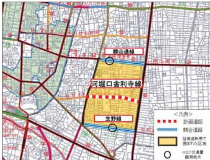
図一河堀口舎利寺線