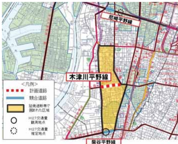
図一木津川平野線