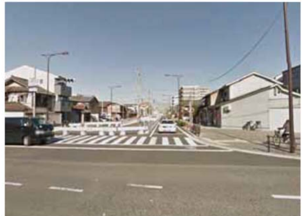
豊里矢田線 事業中箇所