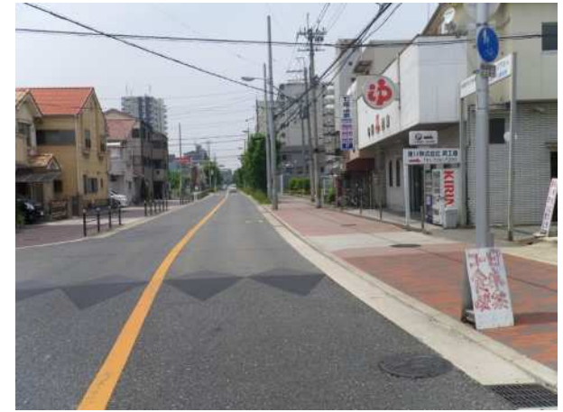
長吉線（旧瓜破長吉線） 事業中箇所 L=665m W=16m