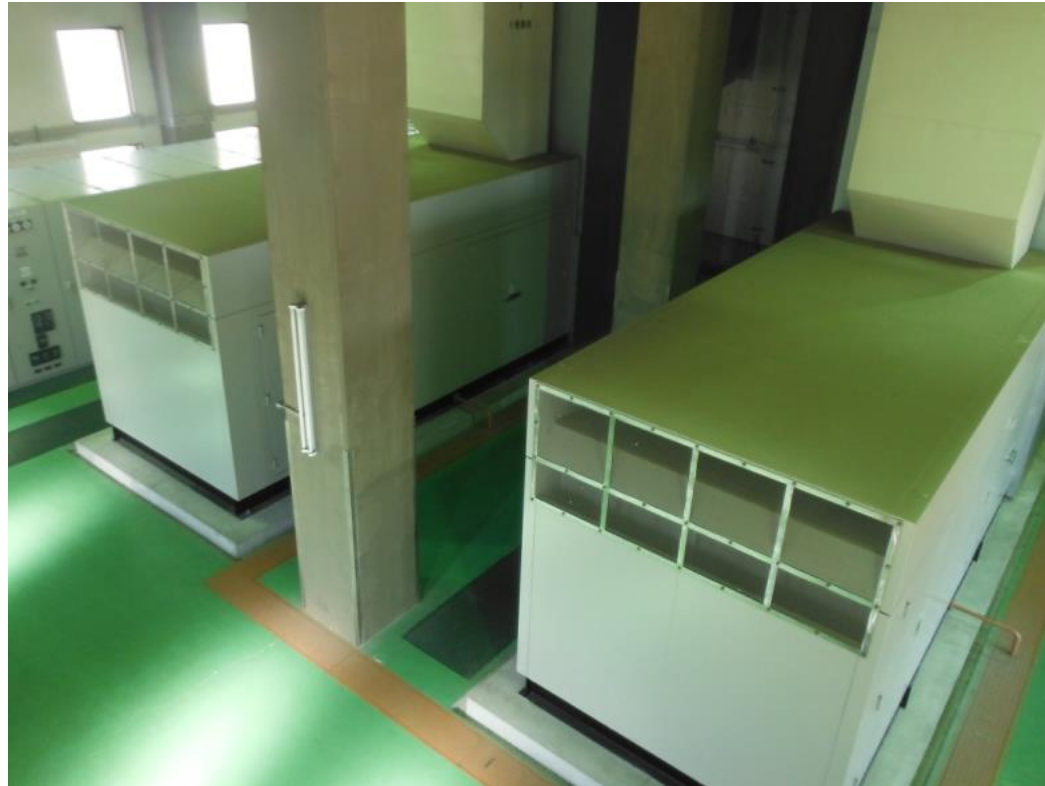
(柴島浄水場上系施設運転用自家発電設備)