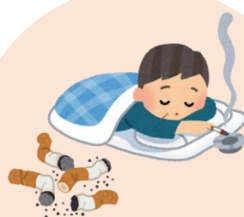
寝たばこ・吸い殻の始末