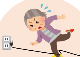
住宅内での 転倒・転落防止