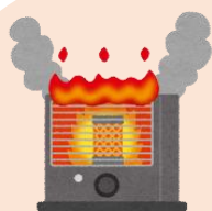
ストーブ使用時の注意点