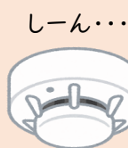
しーん・・・ 住宅用火災警報器 の点検・交換の方法