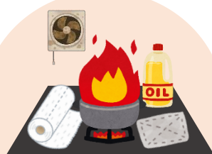
こんろ使用時の注意点